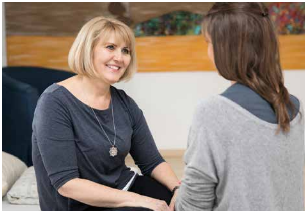
In der Schwangerschaft berät dich unser Team umfassend.