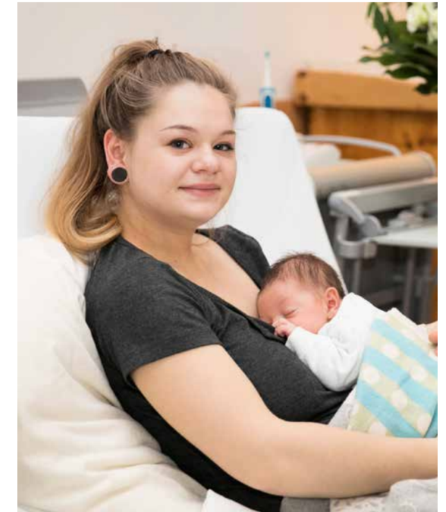
Du kannst dich auch nach der Geburt deines Babys mit deinen Fragen und Anliegen an uns wenden.