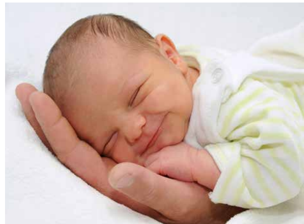
Gemeinsam mit deinem Baby kannst du das Krankenhaus drei bis vier Tage nach der Geburt verlassen.

Wenn es soweit ist, stehen dir Hebammen, sowie Ärztinnen und Ärzte im St. Josef Krankenhaus Wien mit Rat und Tat zur Seite.