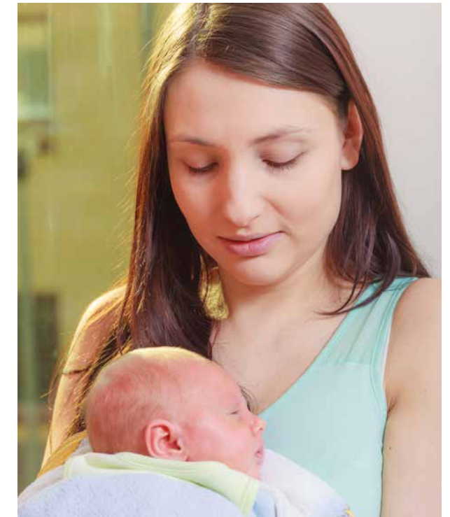
Du kannst dich auch nach der Geburt deines Babys mit deinen Fragen und Anliegen an uns wenden.