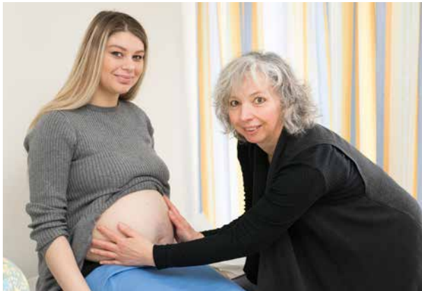
In der Schwangerschaft berät dich unser Team umfassend.