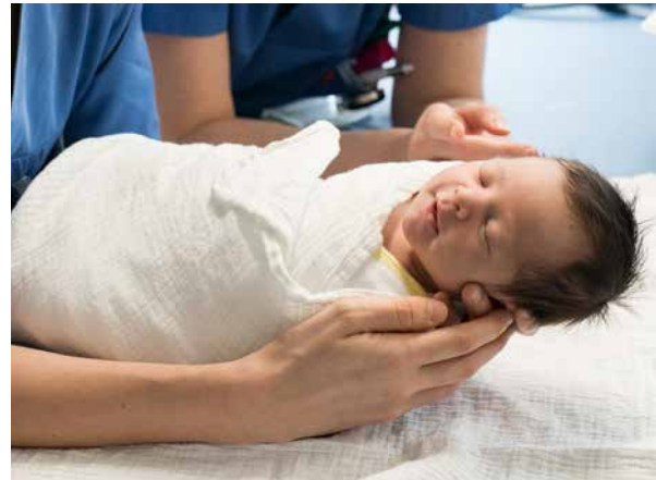
Gemeinsam mit deinem Baby kannst du das Krankenhaus zwei bis drei Tage nach der Geburt verlassen.

Wenn es soweit ist, stehen dir die Hebammen sowie die Ärztinnen* bzw. Ärzte* im St. Josef Krankenhaus Wien mit Rat und Tat zur Seite.