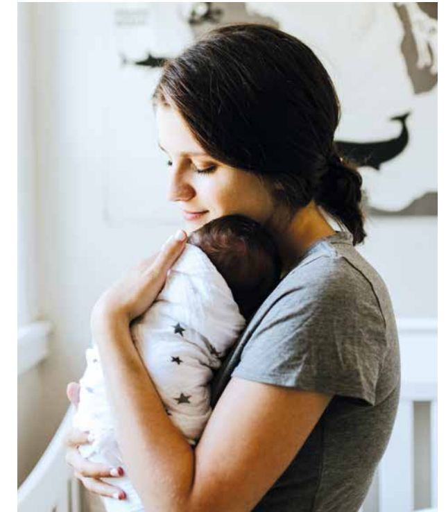
Du kannst dich auch nach der Geburt deines Babys mit deinen Fragen und Anliegen an uns wenden.