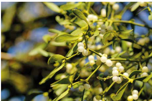
Die weißbeerige Mistel gilt als Heilpflanze.

Im St. Josef Krankenhaus Wien bieten wir unseren Krebspatientinnen und -patienten die Anwendung von Cranio Sacraler Körpertherapie sowie Beratung zum Thema Misteltherapie an.