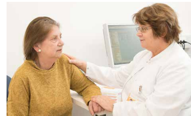
Cranio Sacrale Körpertherapie arbeitet mit Berührung durch die Hände.

Cranio Sacrale Körpertherapie ist eine sanfte, ganzheitliche und achtsame Methode, die mit Berührung durch die Hände arbeitet. Tiefe Entspannung auf der körperlichen und energetischen Ebene wird unterstützt, der Selbstheilungsplan gestärkt.