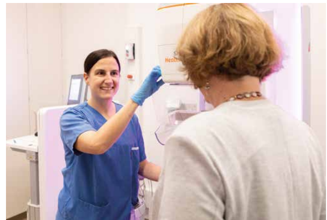
Auch radiologisch sind unsere Patient*innen bestens versorgt.

Ein Schwerpunkt liegt auf dem Bereich Brustgesundheit: Sollte bei einem Ultraschall oder einer Mammographie eine verdächtige oder unklare Veränderung der Brust festgestellt werden, führen unsere Expert*innen eine Zweitbegutachtung und – falls erforderlich – auch eine Brustbiopsie durch. Zudem ist eine weiterführende Tomosynthese oder Kontrastmittel-Mammographie mit unserem hochmodernem Mammographiegerät möglich.